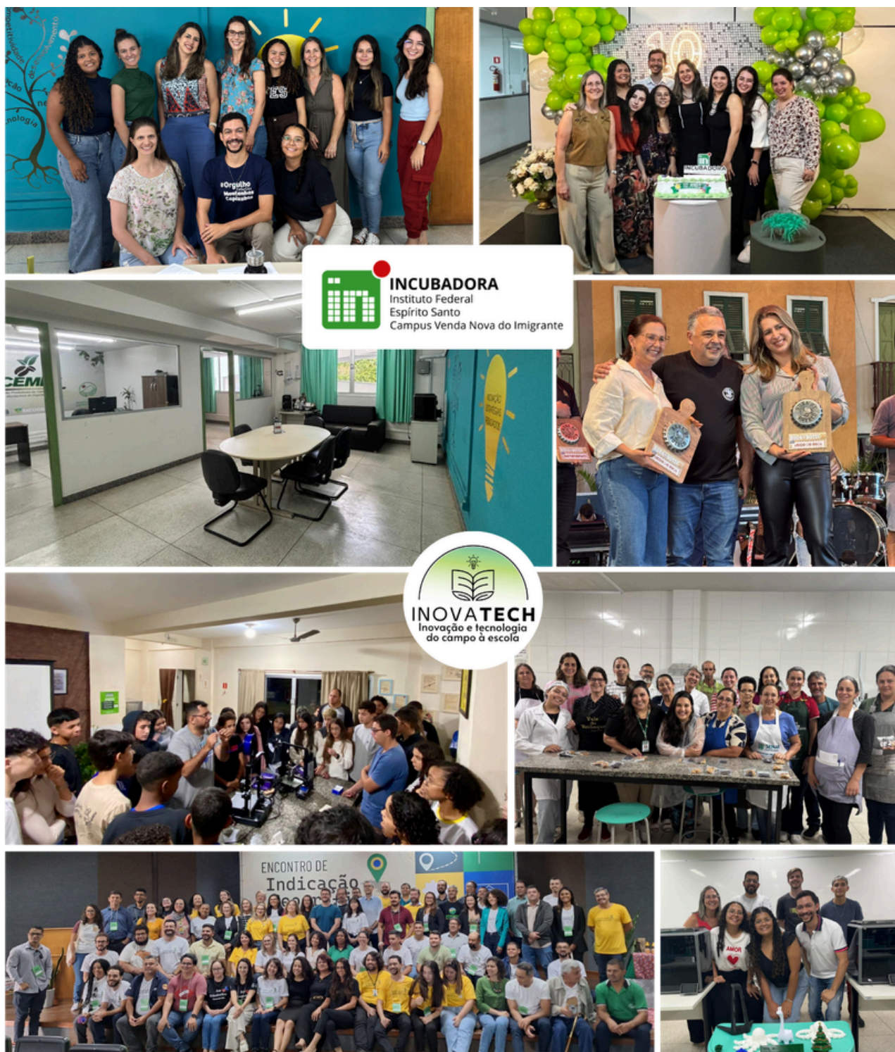
Equipe da Incubadora InovaVNI do campus Venda Nova do Imigrante em participação em eventos

Mais do que incubar negócios, nossa missão é formar empreendedores prontos para transformar desafios em oportunidades de inovação. O Núcleo assume o papel de fomentar o surgimento de empresas e, simultaneamente, contribuir para o desenvolvimento de um ecossistema econômico mais dinâmico e sustentável.