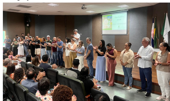
Apresentação dos servidores e servidoras do Ifes – Campus Venda Nova do Imigrante em sábado letivo.

Nossa gestão será pautada pela construção de um ambiente de trabalho saudável, onde o respeito e a dedicação sejam a norma. Entendemos que o ato de ensinar, e todas as funções que o apoiam, são missões que exigem dignidade. Queremos que os servidores e os alunos vejam o campus como um espaço de crescimento não apenas profissional, mas sobretudo humano e social. Nosso compromisso é formar cidadãos de bem, conscientes de que o progresso organizado de uma sociedade depende do equilíbrio fundamental entre a luta pelos direitos e o cumprimento rigoroso das obrigações