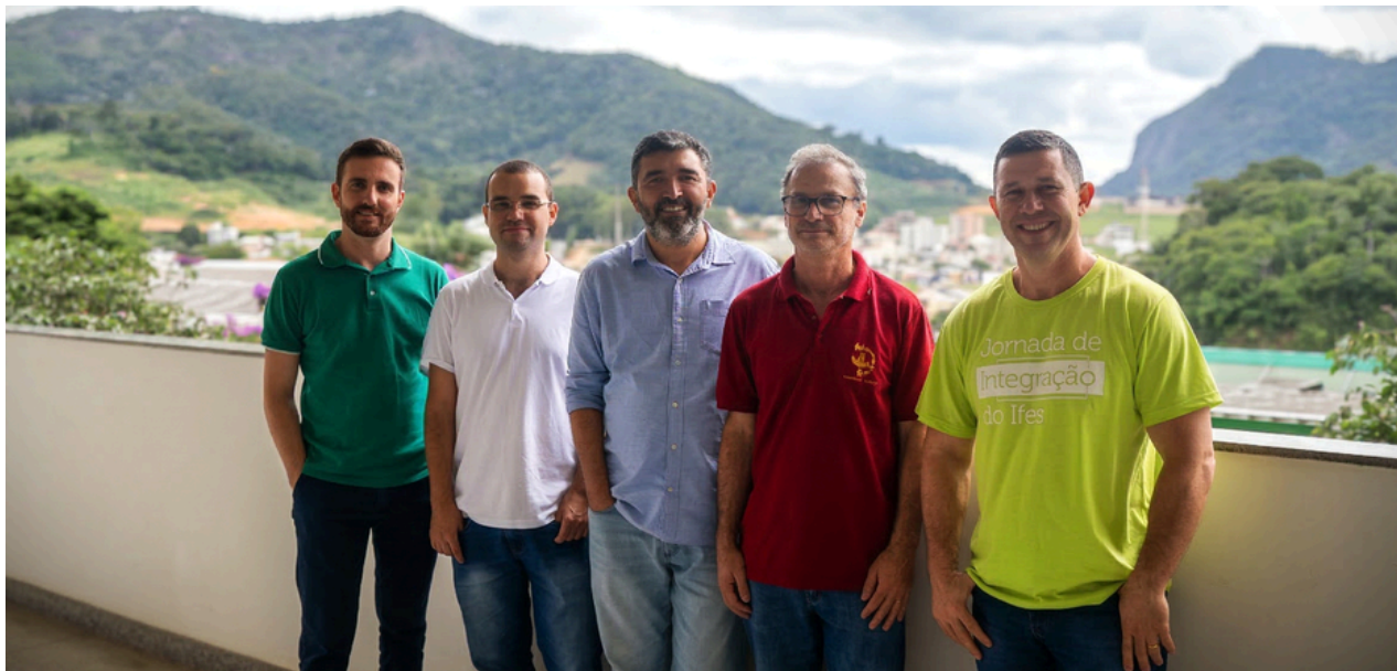
Equipe da Diretoria de Pesquisa, Pós-Graduação e Extensão - DPPGE do campus Venda Nova do Imigrante