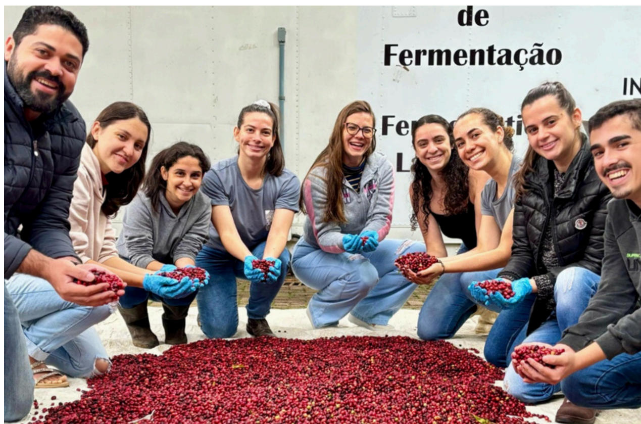
Equipe do Laboratório de Pesquisa Coffee Design