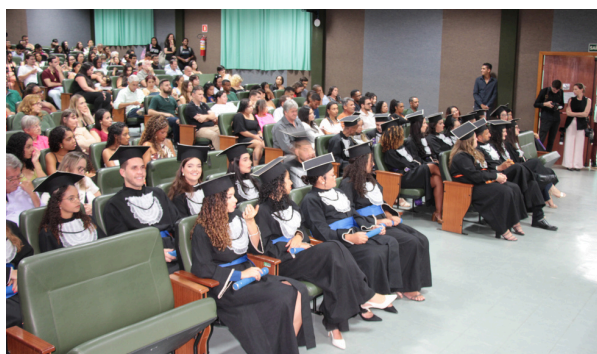
Formatura simbólica dos Cursos Superiores do Ifes

Outro eixo de atenção será a permanência e o êxito dos estudantes. Para isso, a equipe multidisciplinar realizará acompanhamentos e intervenções pedagógicas voltadas ao apoio acadêmico e ao desenvolvimento pessoal dos discentes. A assistência estudantil também será ampliada para além do suporte financeiro, contemplando acolhimento social, orientações sobre saúde mental e física, planejamento dos estudos por meio de atendimentos individualizados e encontros formativos sobre cidadania, pertencimento, relações sociais, respeito às diferenças e direitos humanos.