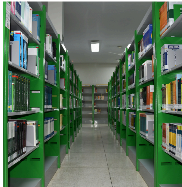
Biblioteca do Campus Venda Nova do Imigrante

Os PCN's entendem que a biblioteca é um espaço apto a influenciar o gosto pela leitura. Recomendando que ela seja um local de fácil acesso aos livros e materiais disponíveis, o documento sugere que a escola estimule o desejo de frequentar esse espaço, contribuindo, dessa forma, para desenvolver o apreço pelo ato de ler.