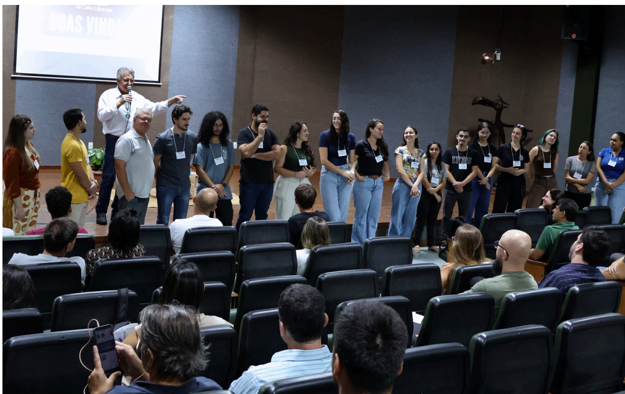
Apresentação da equipe do Coffee Design no Curso de Produção de Cafés especiais